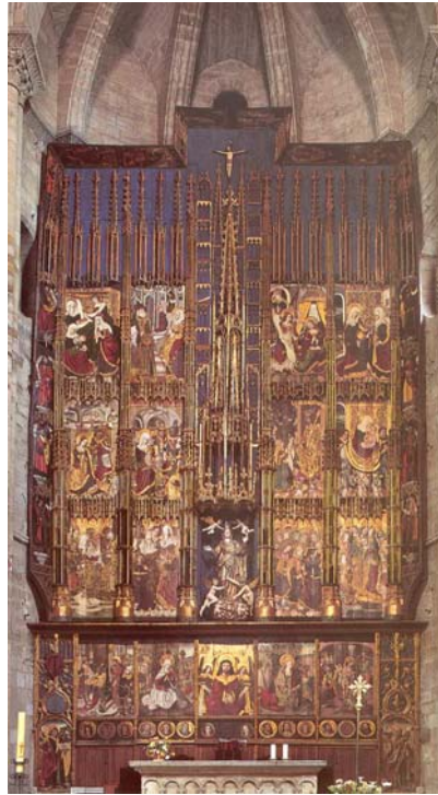
Figura 1: Retablo de la Catedral de Tudela. Fines del siglo XV.