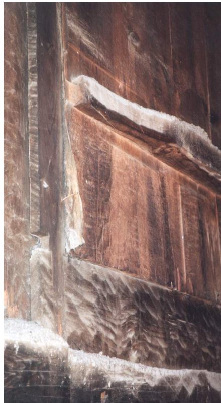
Figura 6: Tablero de la parte posterior de los lienzos del retablo mayor de Cebreros (Ávila). Pinturas de Jusepe Leonardo. Siglo XVII.