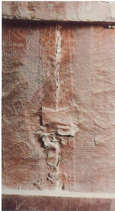
Figura 3: Cola de milano y estopa en el reverso de una tabla. Último tercio del siglo XVI.