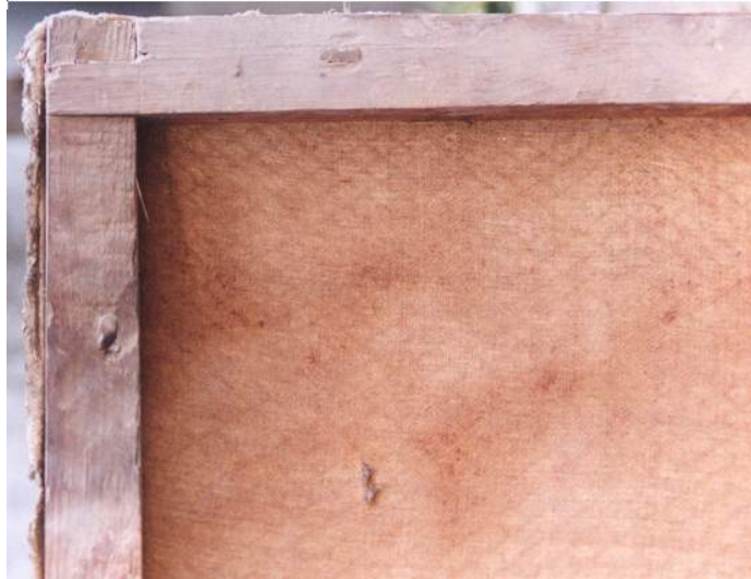
Figura 5: Lienzo tipo mantel montado en su bastidor original. Retablo mayor de Algete (Madrid). Siglo XVII.