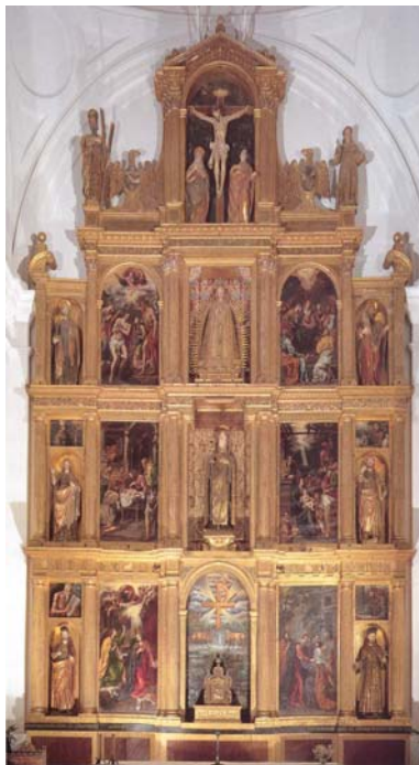
Figura 4: Retablo del Convento de Santa Clara (Toledo). Pinturas sobre lienzo de Lis Tristán. Siglo XVII.