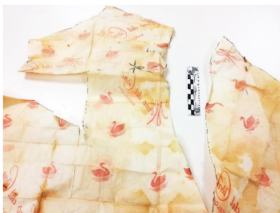
Fig. 2. Detalle del estado de conservación de uno de los patronese de papel.

La colección de Dolores Ribas Badía ha sufrido deterioros considerables a lo largo de los años, sobre todo debido al uso dado a los patronese mientras eran empleados para la confección de prendas y el inadecuado almacenaje de esta durante un largo periodo de tiempo.