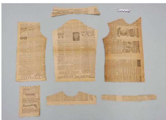
Fig. 3. Ejemplo de uno de los patrones de papel después de ser intervenido.

que presentaban los patrones se ha neutralizado en cierta manera.